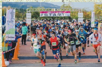
ラピア鹿島 レクトピアパーク Start / Goal