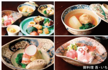
※料理内容は変更になる場合があります。

「ミシュランガイド富山石川版」でピブグルマンを獲得した和食料理店で地元食材を使った料理を堪能しましょう! 飾り付け一つでも自身に妥協を許さない一品が楽しめます!